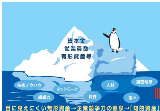
知的資産のイメージ